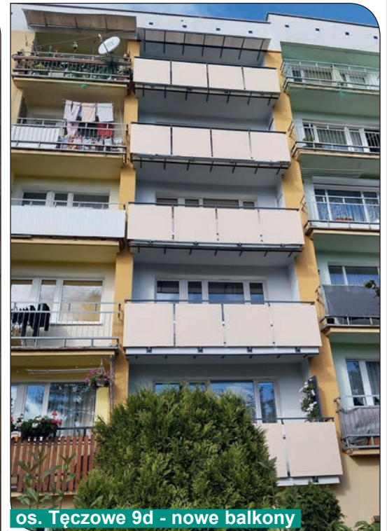
os. Tęczowe 9d - nowe balkony