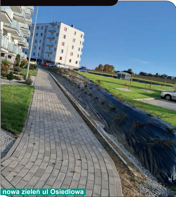
nowa zieleń ul Osiedlowa