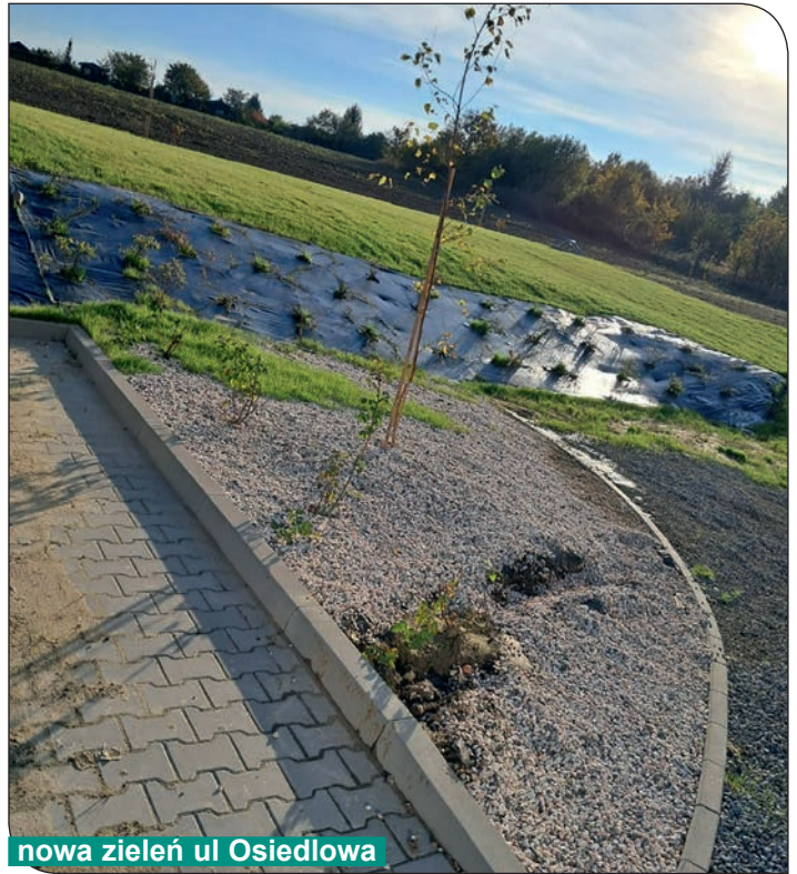
nowa zieleń ul Osiedlowa