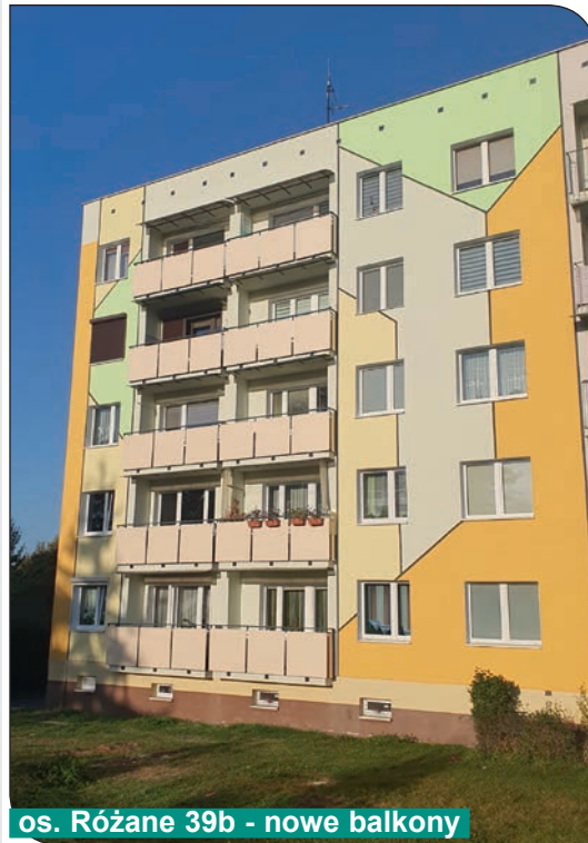
os. Różane 39b - nowe balkony

ozdobne. W ramach prac związanych z remontem balkonów zamontowane zostały nowe zadaszenia nad balkonami.