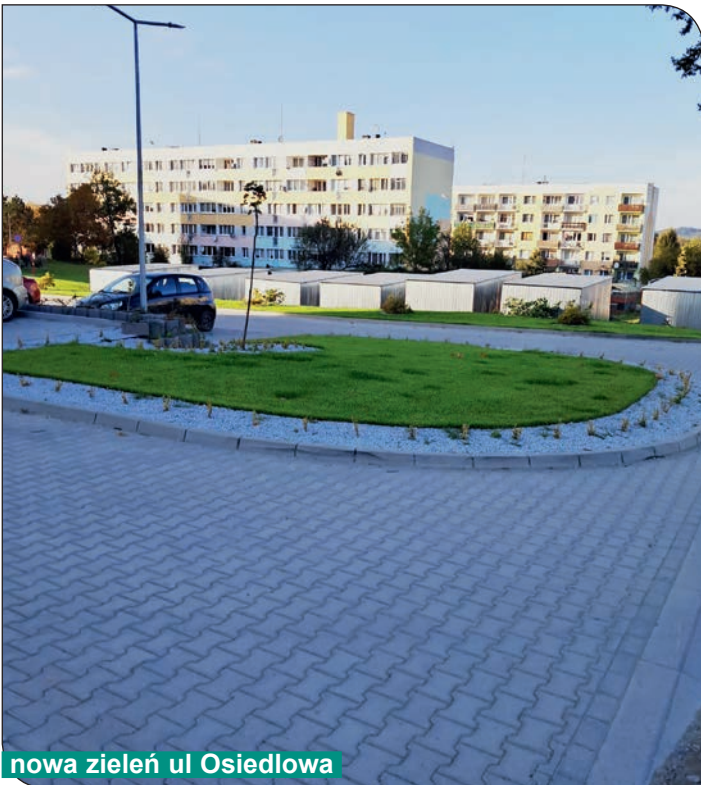
nowa zieleń ul Osiedlowa