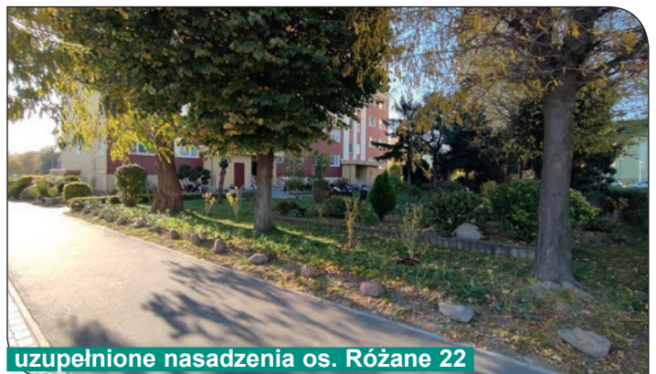
uzupełnione nasadzenia os. Różane 22