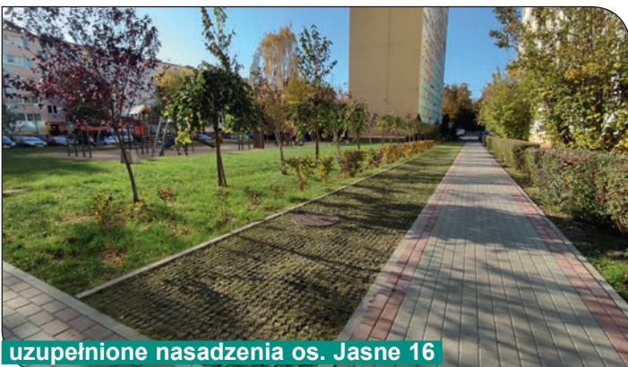
uzupełnione nasadzenia os. Jasne 16