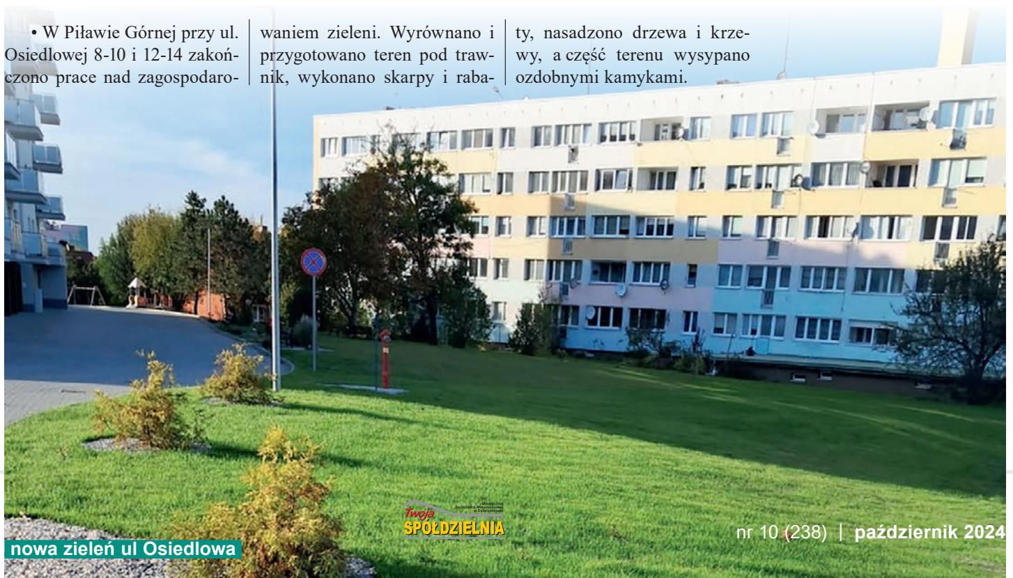
nowa zieleń ul Osiedlowa

ty, nasadzono drzewa i krzewy, a część terenu wysypano ozdobnymi kamyczkami.